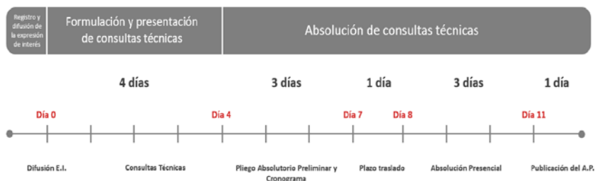
Gráfico 7: Línea del tiempo de la Expresión de Interés.